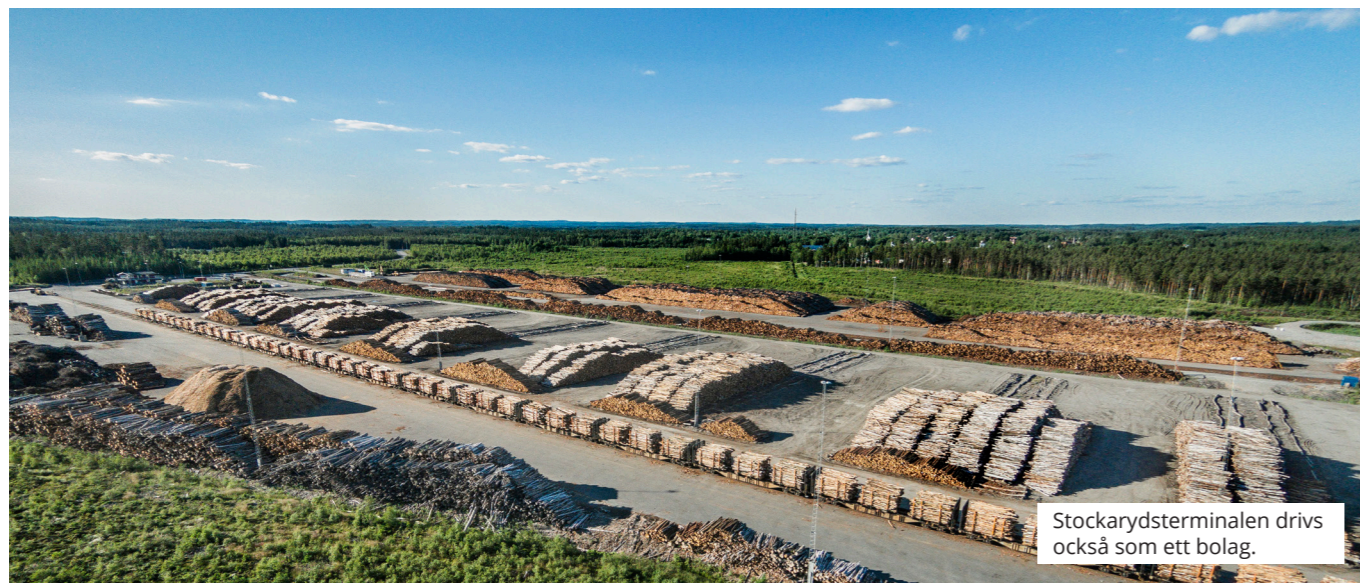
Stockarydsterminalen drivs också som ett bolag.

Kommunen kan även bedriva verksamhet i andra former exempelvis stiftelser, ekonomiska föreningar och handelsbolag. Sävsjö Skyttecenter är ett exempel på en verksamhet som drivs som en ekonomisk förening.