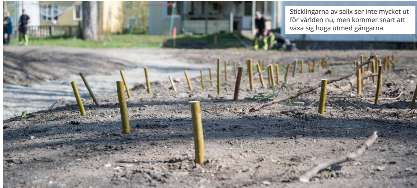
Sticklingarna av salix ser inte mycket ut för världen nu, men kommer snart att växa sig höga utmed gångarna.