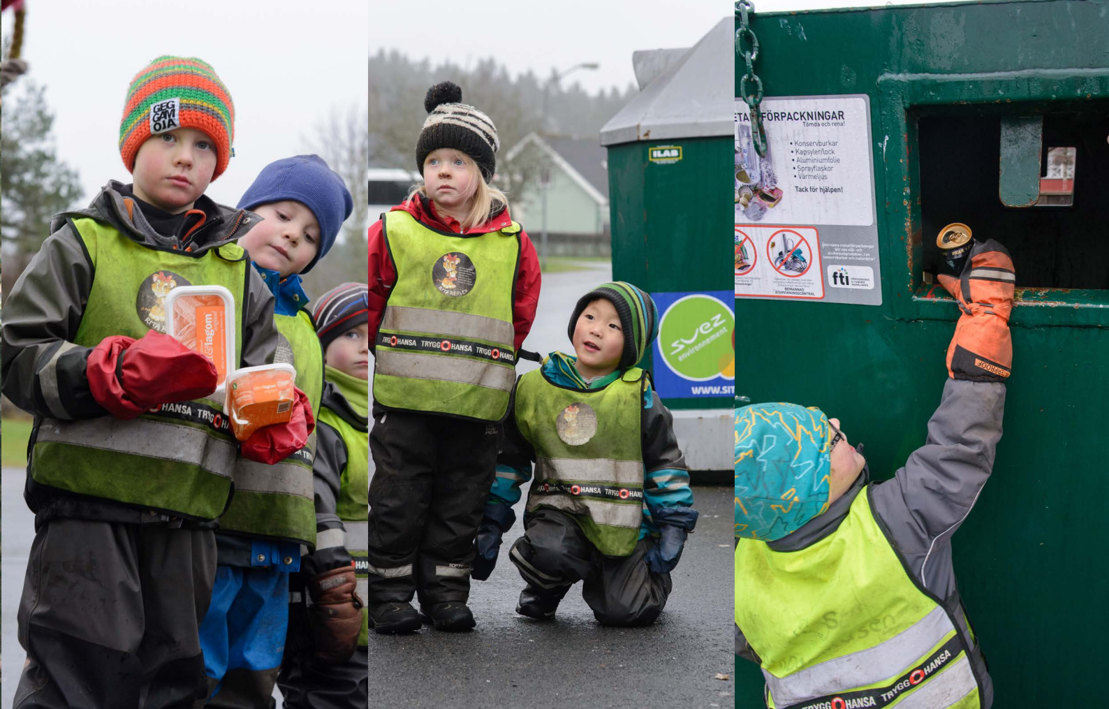
Barnen och personalen på Natur- och miljöförskolan arbetar aktivt för en hållbar utveckling.